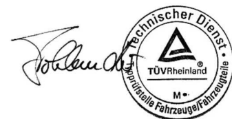
Bohlander Sachverständiger Technischer Dienst Expert Technical Service