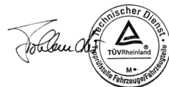
Bohlender Sachverständiger Technischer Dienst Expert Technical Service