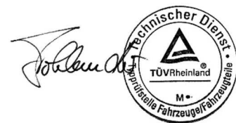
Bohlander Sachverständiger Technischer Dienst Expert Technical Service