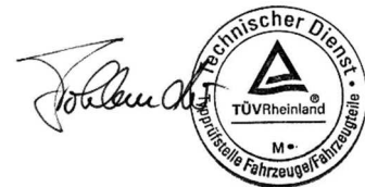
Bohlander Sachverständiger Technischer Dienst Expert Technical Service