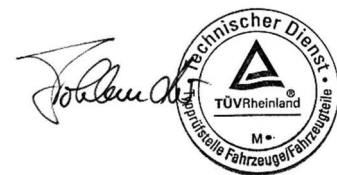
Bohlander Sachverständiger Technischer Dienst Expert Technical Service