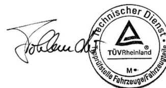
Bohlander Sachverständiger Technischer Dienst Expert Technical Service